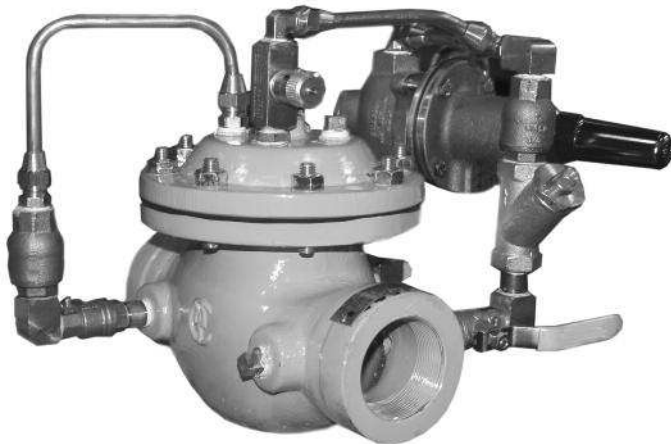
▲ Modelo 127-4

El Modelo 127-4 posee una amplia gama de aplicaciones: En cualquier sitio donde sea necesario reducir una presión a un nivel manejable y donde se deba evitar el flujo inverso.