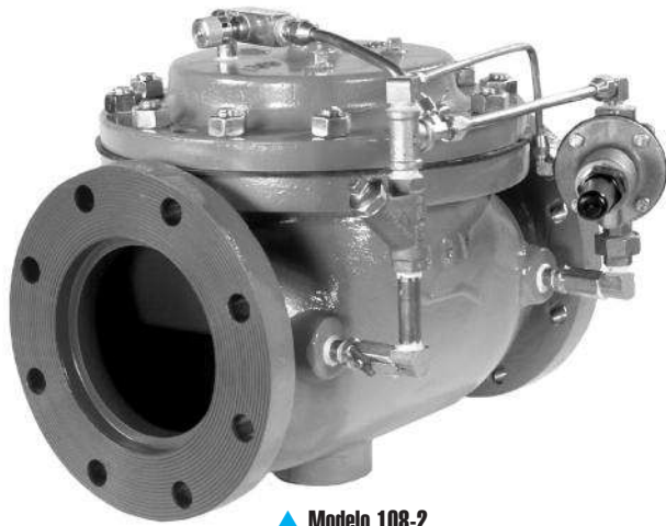
▲ Modelo 108-2

El Modelo 108-2 posee una amplia gama de aplicaciones: cualquier sistema debe estar protegido contra presiones muy altas (escape) o muy bajas (mantenimiento).